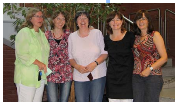
Sozialdienst kath. Frauen e.V.