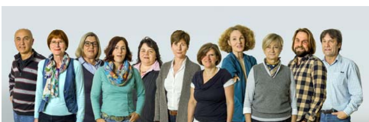
Psychologische Beratungsstelle DWKS