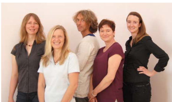
Beratungsstelle für Bewusste Elternschaft